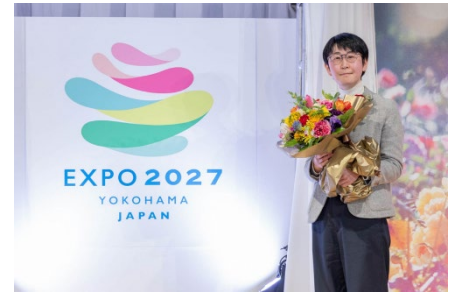
公式ロゴマーク最優秀賞作品と受賞者

応募総数 1,204 作品。「デザイン審査」、「知的財産権関連調査」を通過した最終候補作品から、2月8日に開催された「選考委員会」にて、最優秀賞作品が決定しました。