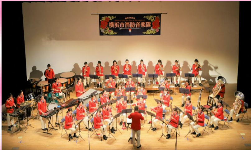
横浜市消防音楽隊 プロフィール