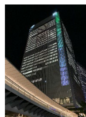
<市庁舎カラーライトアップ>