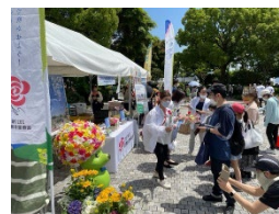
<切り花配付の様子（開港祭）>