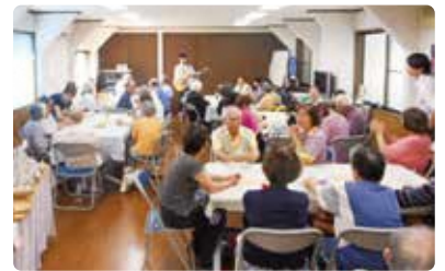
地域カフェの開催