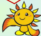
旭区マスコットキャラクター