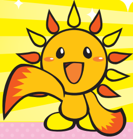
旭区マスコットキャラクター あさひくん

※来場者の状況によりノベルティが変更となる場合がございます。 色柄は指定できません。マスクケース・カードケース・エコバッグどれかおひとつになります。