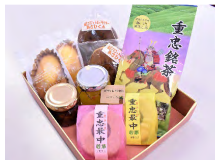
賞品の一例 （「あさひの逸品」詰め合せ）