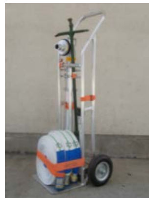
スタンドパイプ式 初期消火器具(可搬式)