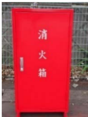
初期消火箱（固定式）

初期消火器具には、初期消火箱（固定式）とスタンドパイプ式初期消火器具（可搬式）の2種類があり、消防車が進入できない道路狭隘地域等においても、消火栓にホースを直接接続し、有効な初期消火活動を行うことができる消火器具です。特にスタンドパイプ式初期消火器具は機動性に優れ、容易に取り扱うことができます。