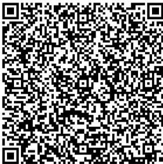
▲部数・配送先両方変更