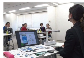
スマホ教室の様子