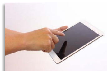
体験でご使用いただく タブレット(イメージ)