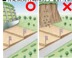
■特定開発行為に対する許可制