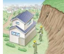
■建築物の構造規制