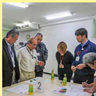
講座で得た地域活動をヒントに自分の地区で実践したいことを「みらいプラン」として記入

第1講を受講した時点では「課題が山積みで何をどう手をつければいいのか」と悩んでいた人も、最終回に作成した「みらいプラン」では具体的な目標と最初に取り組むべきことが明確になっていました。新あさひみらい塾へはこの2年間で15の地区が参加。昨年度を受講生の中には、すでにサロンやボランティアグループを立ち上げた人や、仲間を増やして活動を広げている人もいます。講座修了後も交流や事例発表などの機会を持って互いに高め合いながら、あさひの未来を切り開いていきましょう。