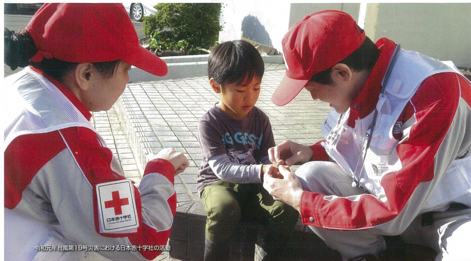
令和元年台風第19号災害における日本赤十字社の活動