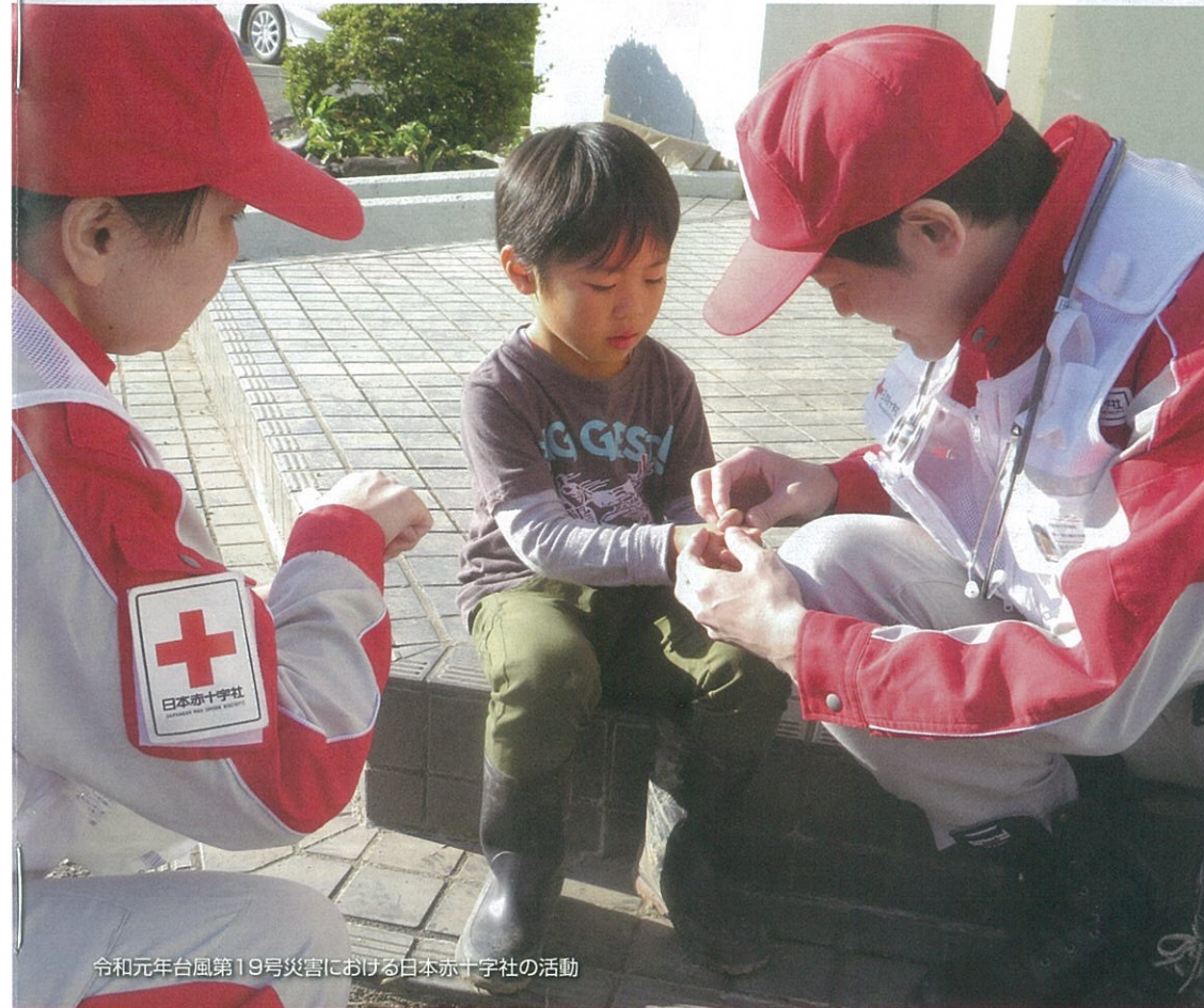
令和元年台風第19号災害における日本赤十字社の活動