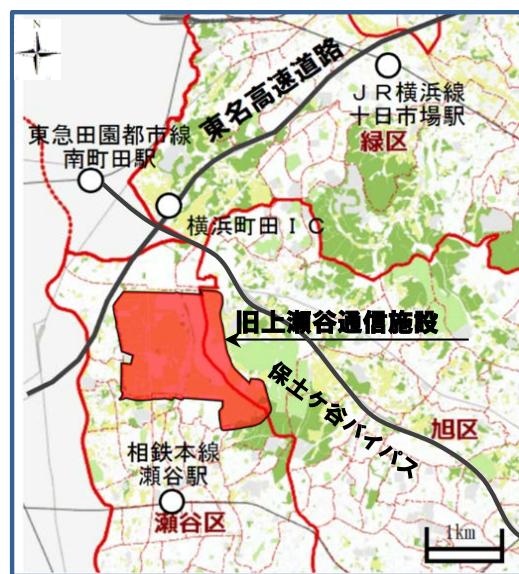
「旧上瀬谷通信施設の位置」