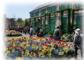
国際園芸博覧会イメージ

花と緑のあふれる暮らしや地域の創造を目的に開催される国際的な博覧会です。横浜市が目指しているのは国が開催主体となる博覧会で、国内では、1990 年に大阪で開催された「国際花と緑の博覧会（花の万博）」があります。