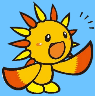
旭区マスコットキャラクター あさひくん