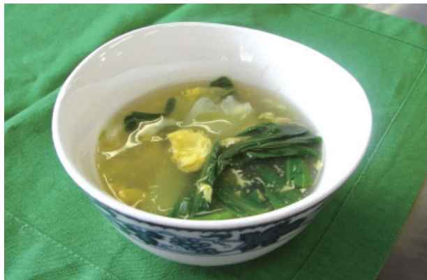
チンゲンサイと卵のとろーりスープ P44