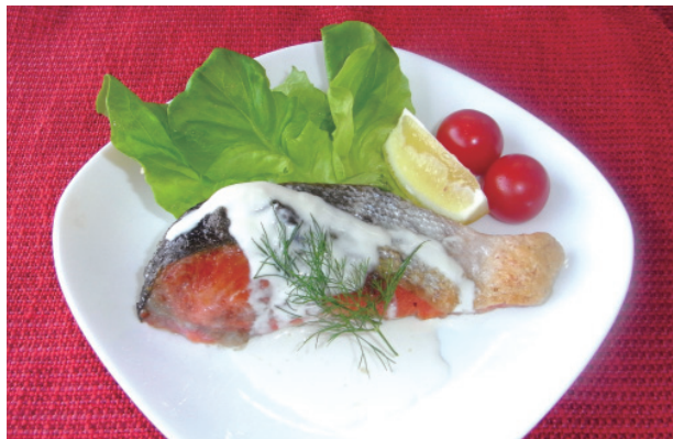
生鮭の簡単ムニエル P20