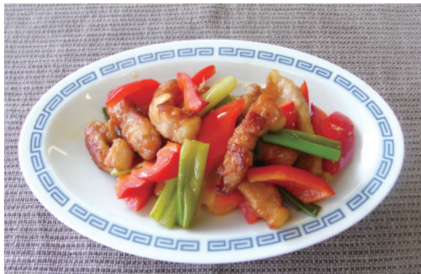
豚肉とパプリカの黒酢の酢豚 P29