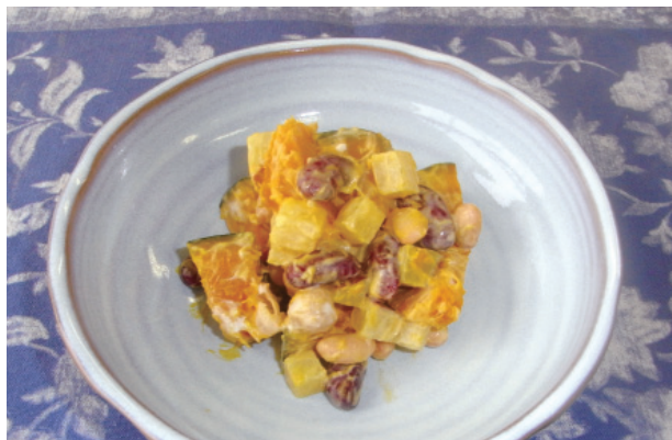
かぼちゃとさつまいもの豆サラダ P49