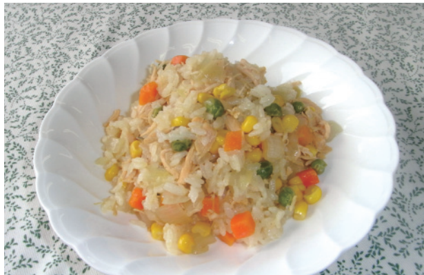
カレー味のピラフ風 P19