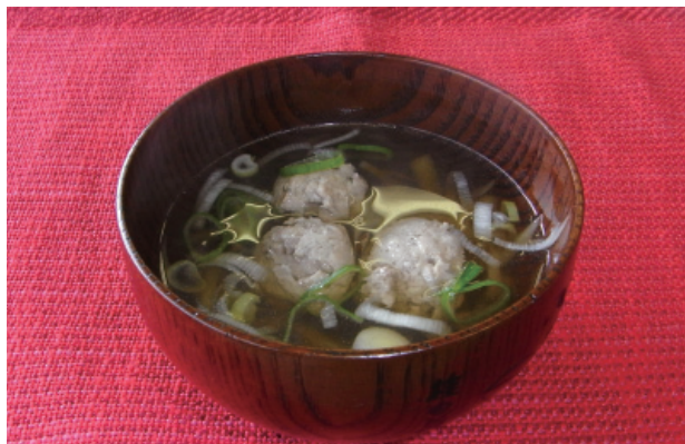
いわしのつみれ汁 P23