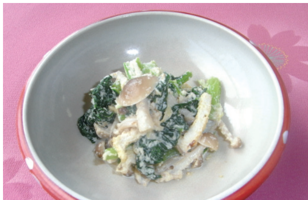
小松菜のごまマヨネーズあえ P37