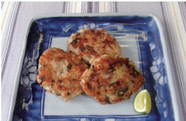
鶏ひき肉の変わり焼き P25