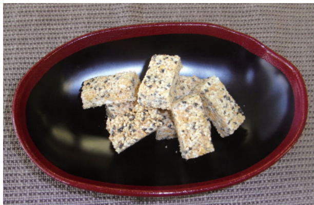
ごまのソフトおこし P54