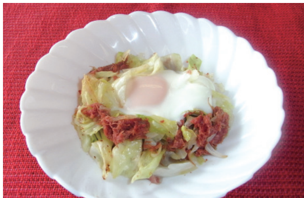
キャベツとコンビーフの巣ごもり風 P28