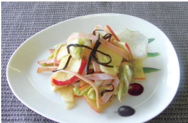
白菜と塩昆布のもみサラダ P43