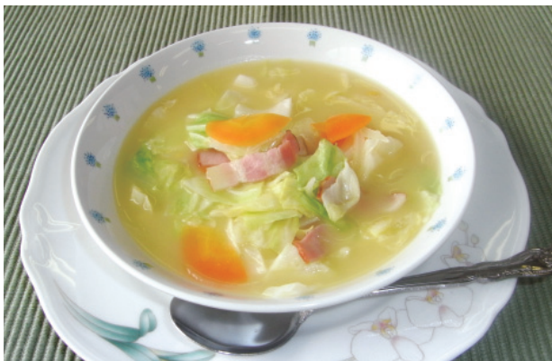
キャベツのスープ煮 P45