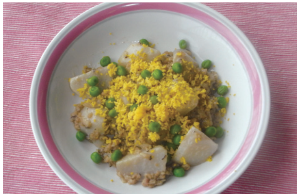
里芋のそぼろ煮黄味ちらし P26