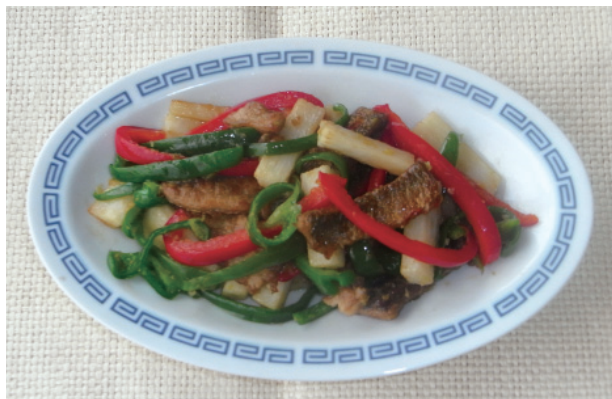
さんまと長いもの中華炒め P24