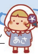
きらっとあさひプラン マスコットキャラクター あさちゃん きらっとあさひプランの 詳細はこちら