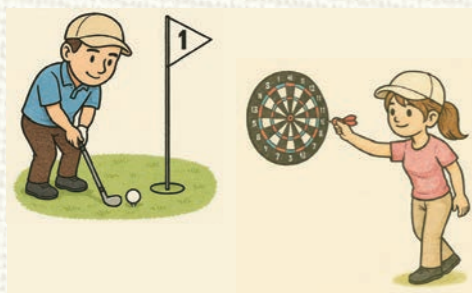
新たに立ち上げたサークル