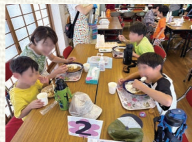
市沢ほっこり食堂