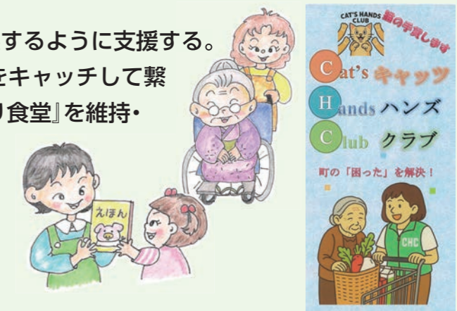
『キャッツ ハンズ クラブ』パンフレット