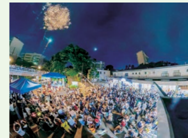
左近山のお祭り 団地祭をはじめ、各自治会の お祭りが盛んです