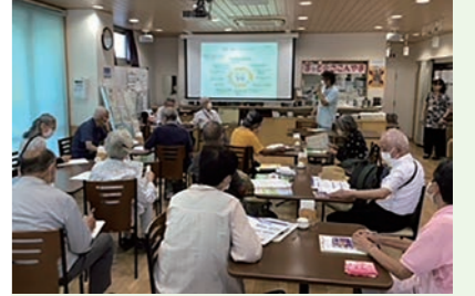
認知症サポーター養成講座 地域の方の認知症への理解を深める 機会として、ほっと*さこんやまで 年一回開催しています

左近山特別支援学校と 地域サークルとの交流 地域の皆さんとふれあうことで 協同の大切さを学んでいます