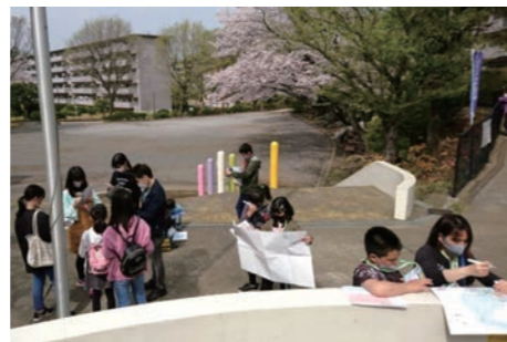
左近山スタンプラリー 支えあいネットワーク主催の楽しい地域交流イベント！ 左近山をぐるっと一周