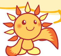
旭区 マスコットキャラクター あさひくん

きらっとあさひプランを みんなで話し合い、確認しながら 取組を進めることが大切なんだね！