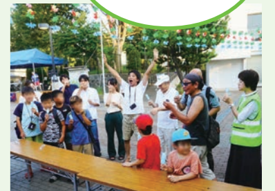
商店街イベント 毎月開催している商店街イベントを 多世代の活躍で盛り上げています！