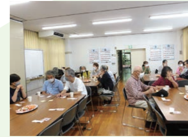
ほっこりカフェ だれもが気軽に立ち寄り、ほっこりする憩いの場です