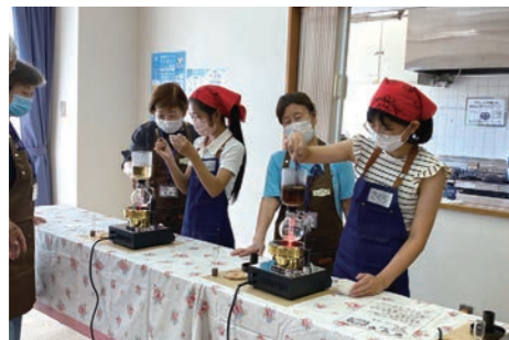
ジュニアボランティア 小学校5・6年生の有志がボランティア団体と交流をしました