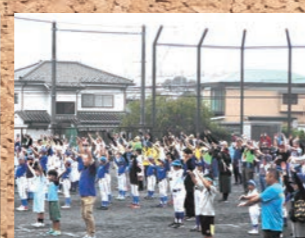
レクリエーション大会(10月)