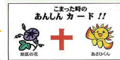
発行元 旭区・今宿地区町内会自治会連合会