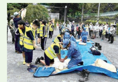
中学生ボランティア活動