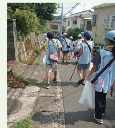
ジュニアボランティア清掃活動