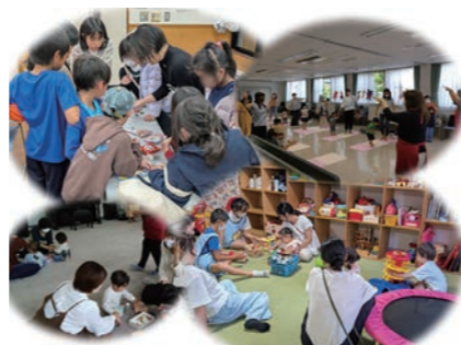
子育て支援の取組