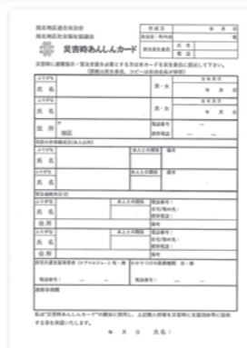
災害時あんしんカード