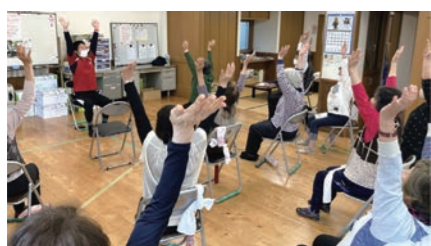
いきいき白根 (白根町内会館)