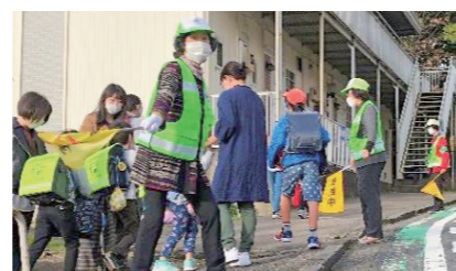
小学校児童登下校見守り不動の森「学援隊」