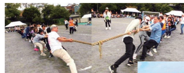
ふれあい大運動会