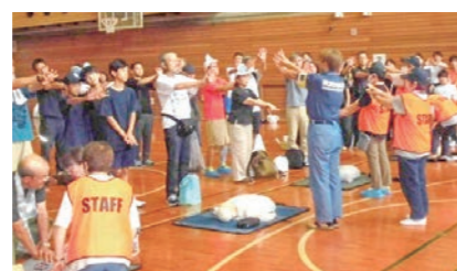
白根地区連合防災訓練