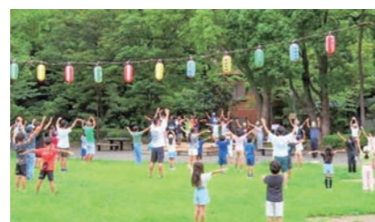
ラジオ体操 (白根公園)