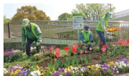
公園愛護会 (白根公園)