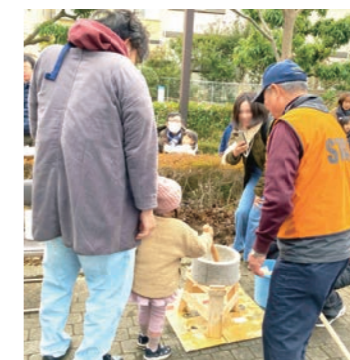
新春子供大会 もちつき