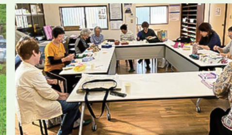
老人会白根支部 相寿会 (相友自治会館)