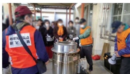
地域防災拠点訓練 (不動丸小学校)