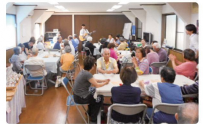
地域カフェの開催