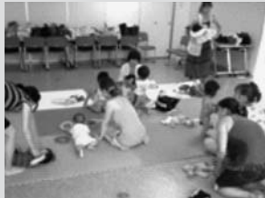
(K. K. ネットの活動)