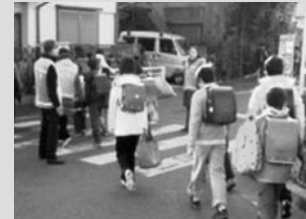
(黄色いベスト見守り活動)