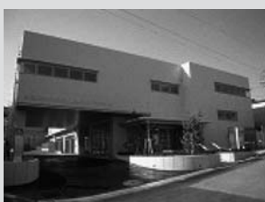
(南希望が丘地域ケアプラザ)