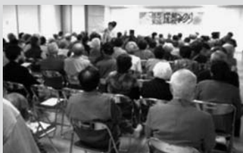
(民児協と友愛活動推進員共催の談笑のつどい)