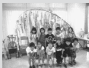
(子どもたちの笑顔)