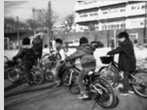
(親子自転車安全教室)