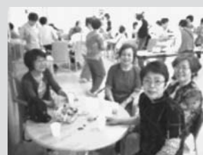
(来所された地域の方々)