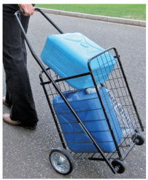
▲ポリタンクとカート