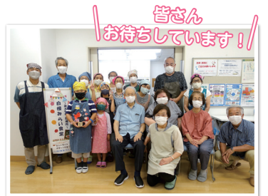
▲白根みらい食堂の皆さん