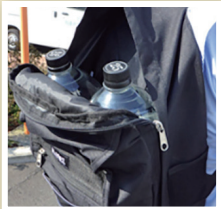
▲ペットボトルの入るリュックサック

災害時給水所に容器の用意はありません。水は重いので、自分の体力や自宅までの道(階段の有無など)に合った容器や道具を準備しましょう。