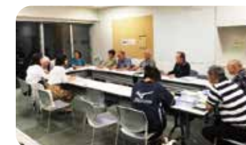
キャッツ ハンズ クラブ 定例会