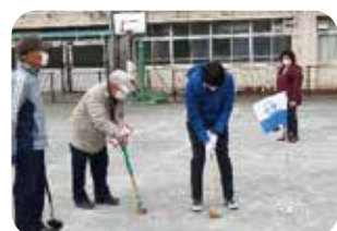
▲健康づくりグラウンドゴルフ大会 にこにこ料理教室▶