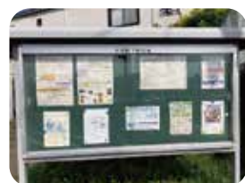
▲町内31カ所に設置されている掲示板