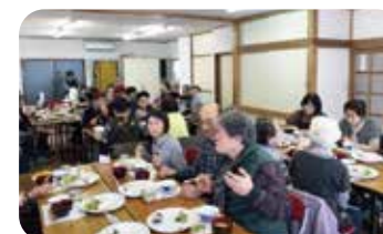
よろこびの会 昼食会