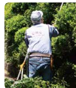
▲キャッツ ハンズ クラブ