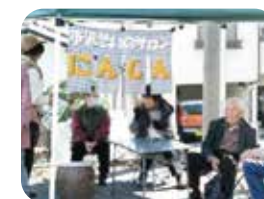
▲青空サロン にんじん