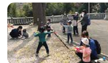
地区社協主催 ふれあい広場