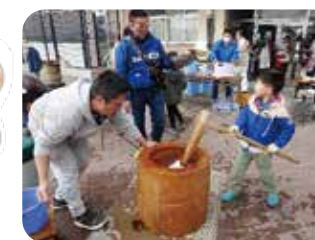
市沢っこ餅つき大会