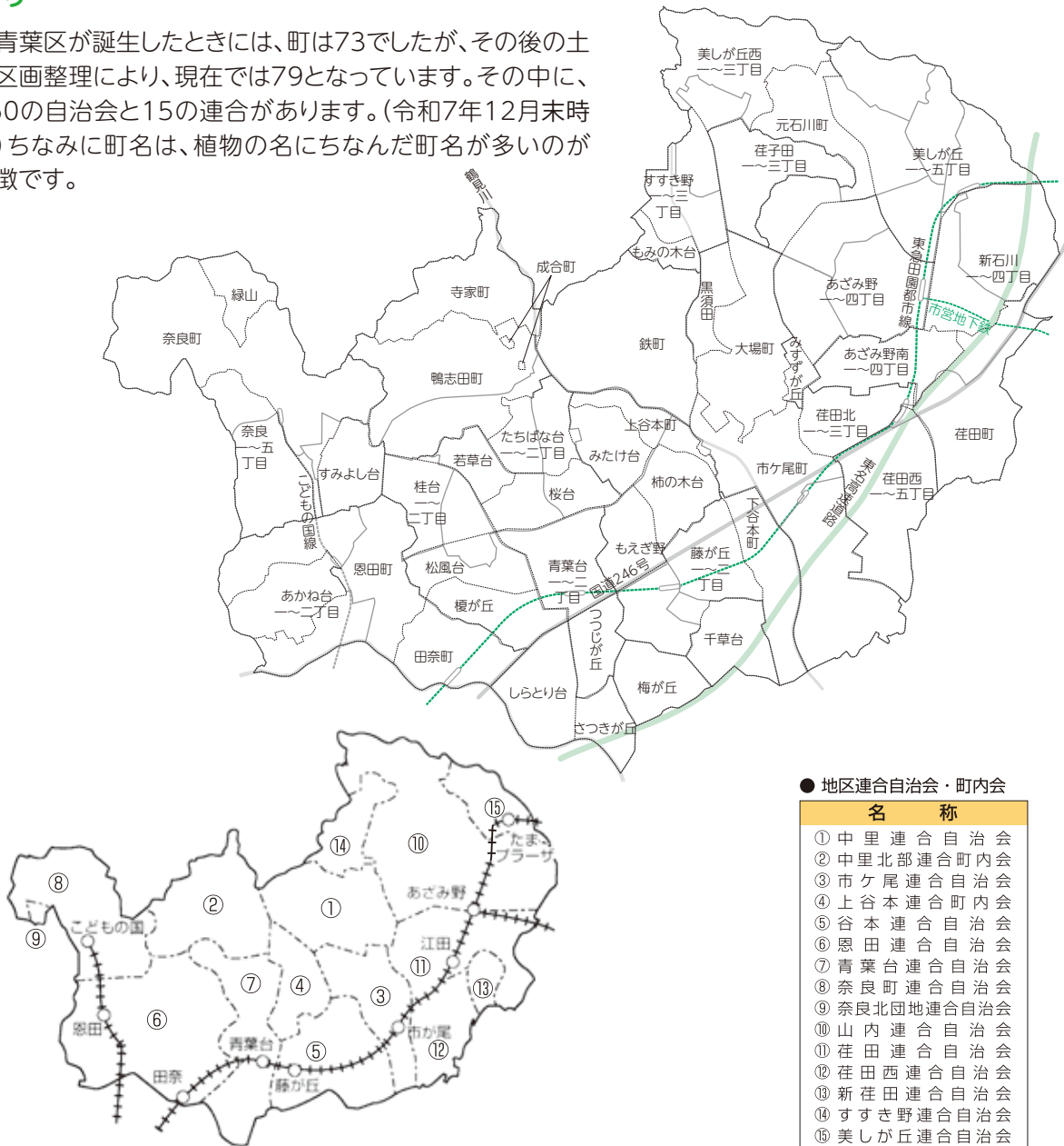
青葉区自治会・町内会加入世帯数・加入率の推移(各年4月1日現在)

青葉区が誕生したときには、町は73でしたが、その後の土地区画整理により、現在では79となっています。その中に、160の自治会と15の連合があります。(令和7年12月末時点) ちなみに町名は、植物の名にちなんだ町名が多いのが特徴です。