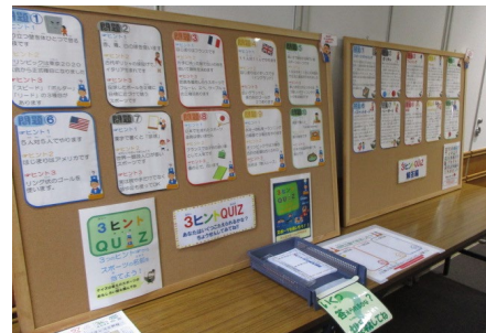
オリンピックを盛り上げよう