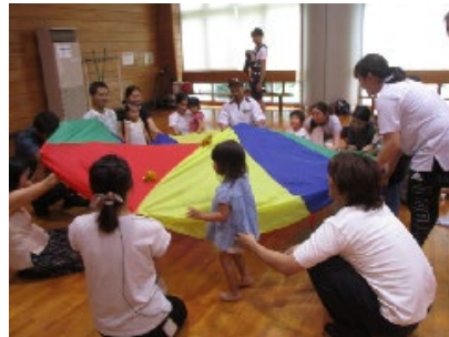
パパママ参加リトミック