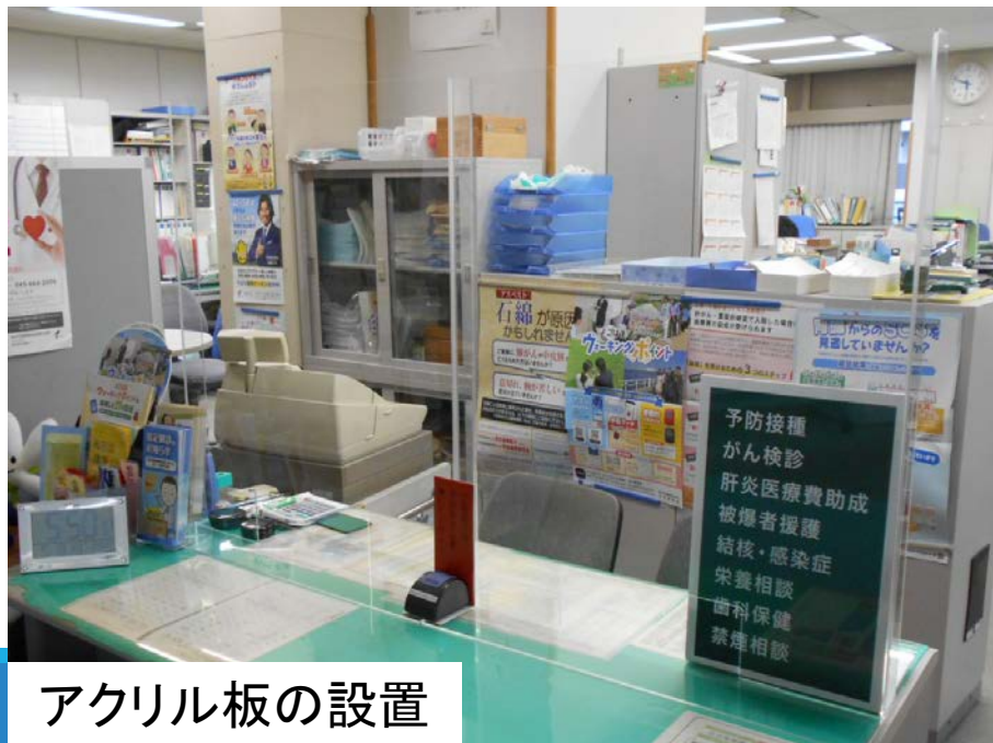
アクリル板の設置