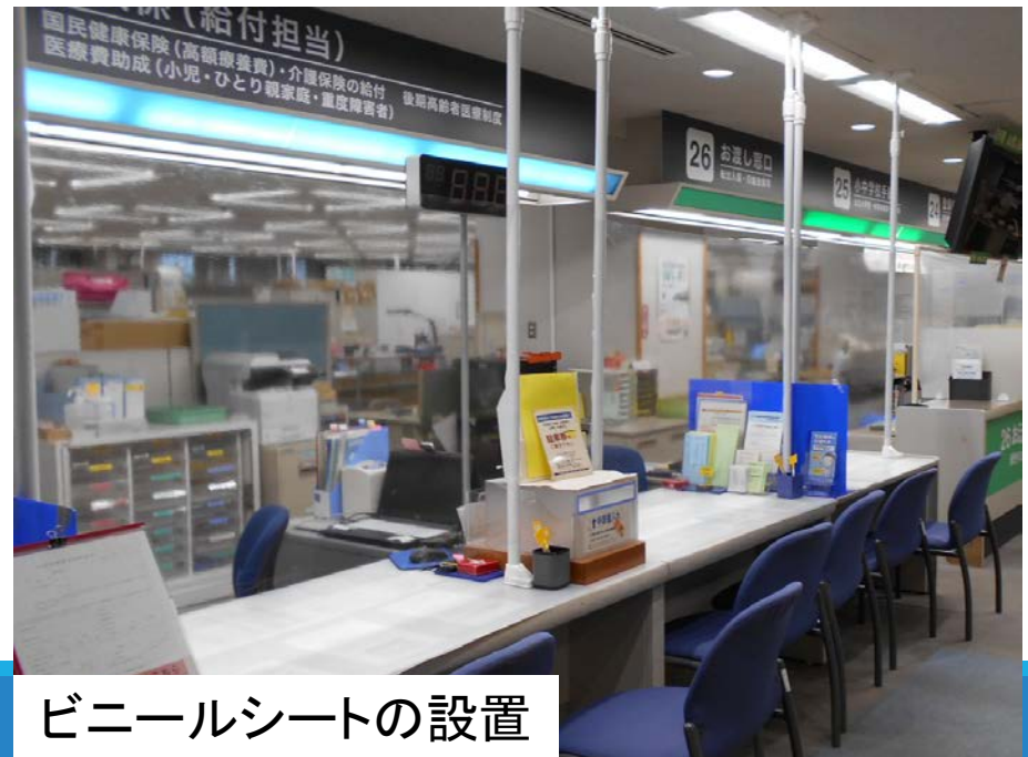
ビニールシートの設置