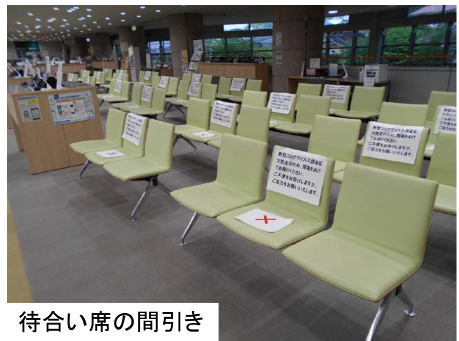
待合い席の間引き