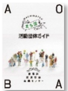
「まち活活動団体ガイド」

このたび、新規登録団体を募集します。活動やイベントの情報をギャラリーやラジオなどで発信したり、活動団体向けの講座や交流会などをご案内します。新規・更新とも6月30日(水)までに登録された団体は冊子「まち活活動団体ガイド」に掲載します。この機会にぜひお申し込みください。