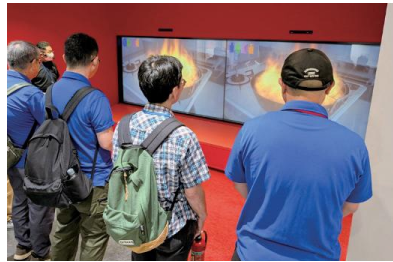
消火器を使った消火体験