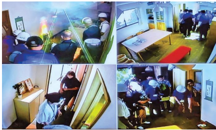
豪雨に因る浸水、火災、停電を体験