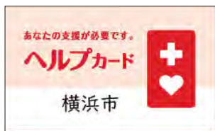
ヘルプカード(表紙)

外見からは支援や配慮を必要としていることが分からない方が携帯することにより、災害時や日常生活の中で困ったときに、周囲の方に自身の障害等の支援や配慮を求めるカードです。