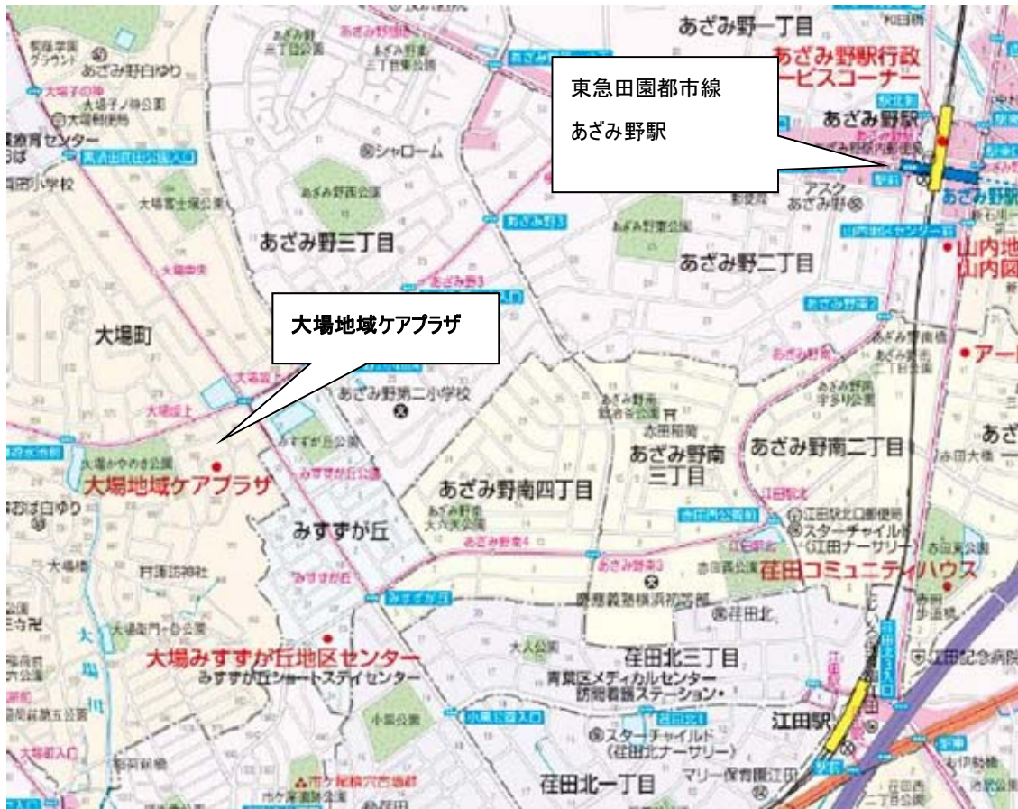
あざみ野駅から東急バス「あざみ野ガーデンズ行」にて、「大場坂上」下車徒歩3分