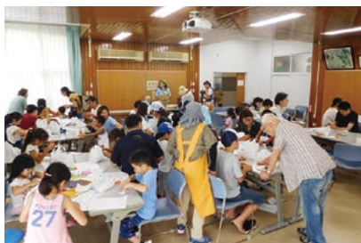
こどもなつまつり