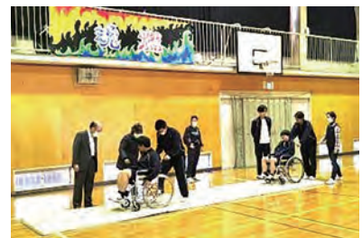
中学校での福祉教育