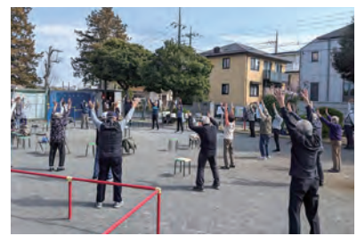
ラジオ体操&ハマトレ