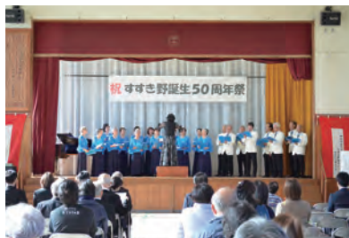
すすき野誕生50周年祭