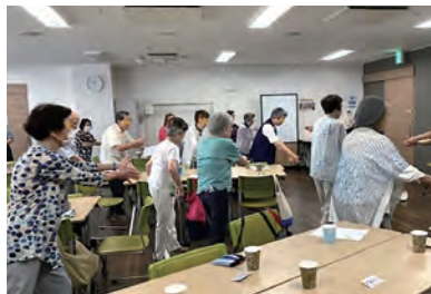
美しが丘おたのしみ会