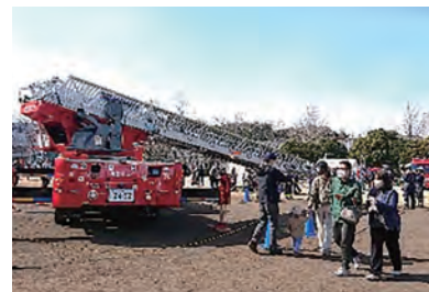
すすき野防災フェア