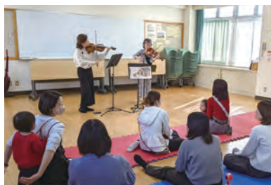
子育てひろば「すくすく」