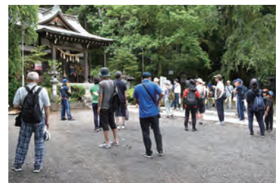
ファミリーウォーキング