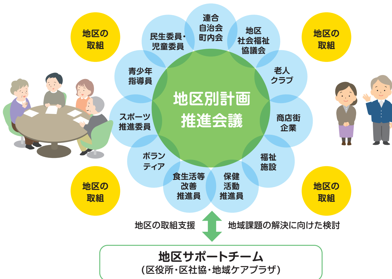
〈地区別計画の推進体制イメージ〉

青葉区は15の地区連合エリアごとに区役所・区社協・地域ケアプラザで「地区サポートチーム」を構成しています。地区サポートチームは、各地区の計画策定・推進を支援します。