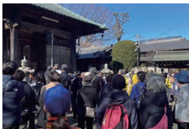
推進会議主催ウォーキング