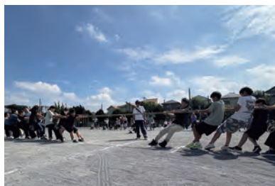
スポーツフェスティバル