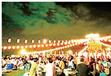
ふるさと祭り盆踊り大会