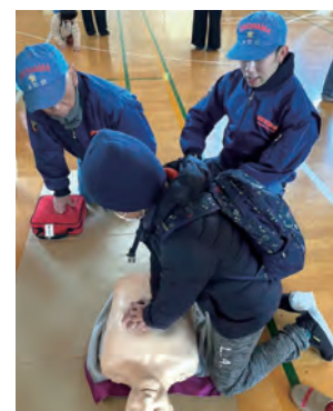
地域防災拠点防災訓練