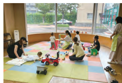
子育てひろば「おかあさんといっしょに」