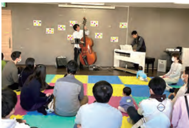
子育て支援ライブ