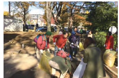
美しが丘公園落ち葉清掃