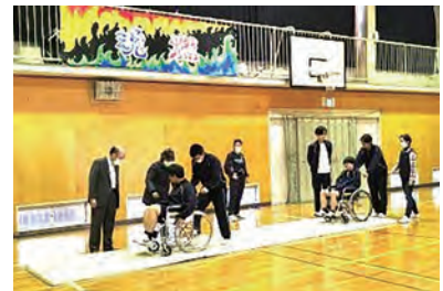
中学校での福祉教育