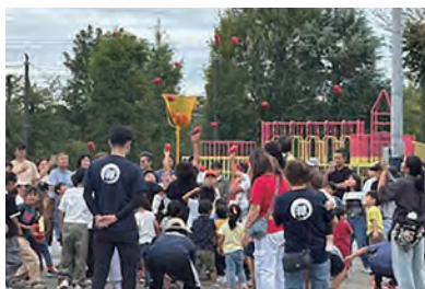
連合スポーツ大会