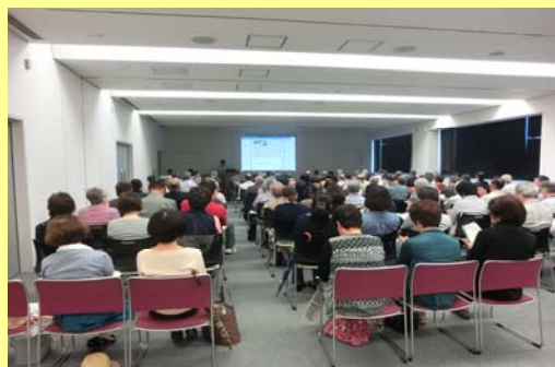
和田先生による講演会の様子