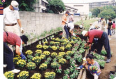
みんなの力できれいなまちに(上矢部町)

もっと手を入れればずっと良くなるのに…と思ったら、みんなで少し手を加えてみませんか。