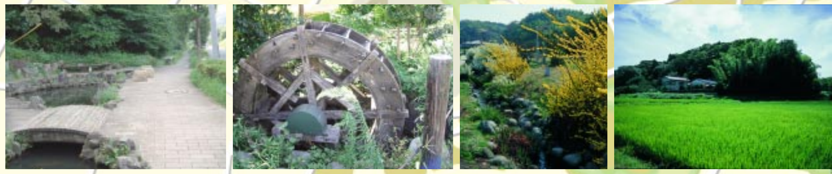
① アメニティの休憩所 ② 水車 ③ 小川アメニティ ④ 田園風景