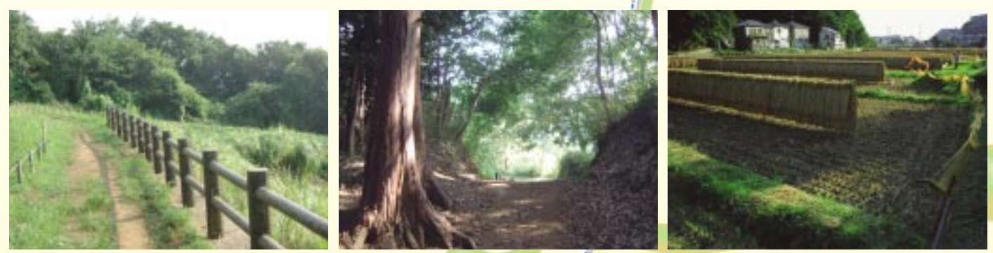
① 眺望ポイント ② 森の中の散策路 ③ 田園風景