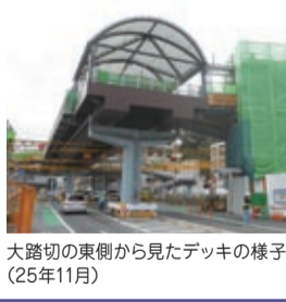
大踏切の東側から見たデッキの様子(25年11月)