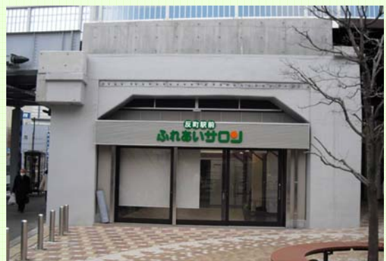
反町駅前広場から見た集会所

* 「散歩道づくり通信 22 号」は、都市整備局ホームページでもご覧になれます！！また、これまで発行してきた「散歩道づくり通信」バックナンバー（創刊準備号～21 号）についても掲載しており、跡地整備のこれまでの検討の経緯や、基本設計図等もご覧になれます。ぜひ、ご覧ください。