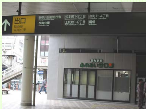
反町駅改札口から見た集会所