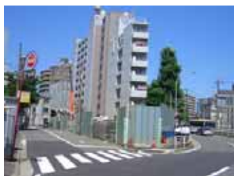
青木浅間線交差部付近