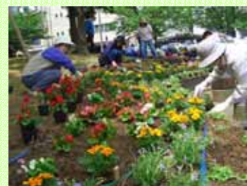
楽しく植えました