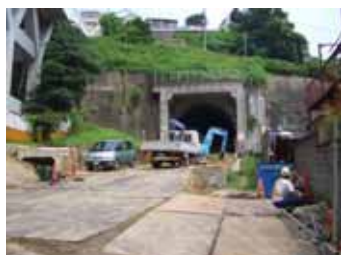
横浜側トンネル出口