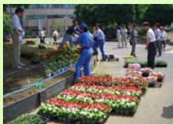
花苗を配置してみましよう