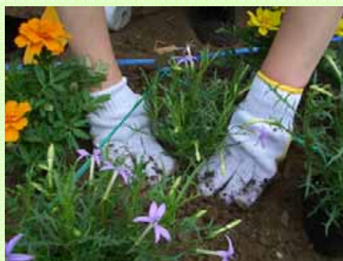
ひとつひとつ丁寧に!