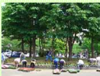
こんなに広い範囲を