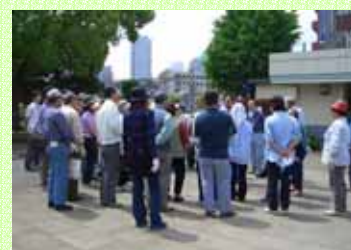
さあ皆さん、作業開始です