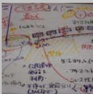
ぎっしりと書き込まれた提案の数々