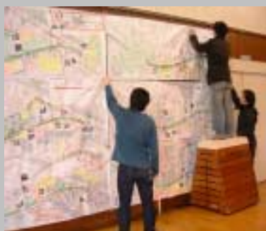
壁に貼るのも大変！！