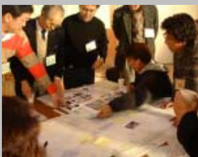
次第にリアリティが