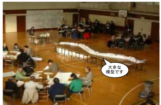
二谷小学校の体育館で行いました