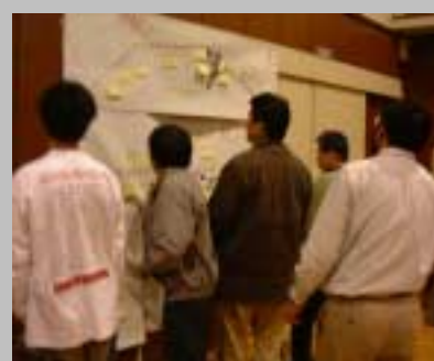
他のグループの成果に見入る