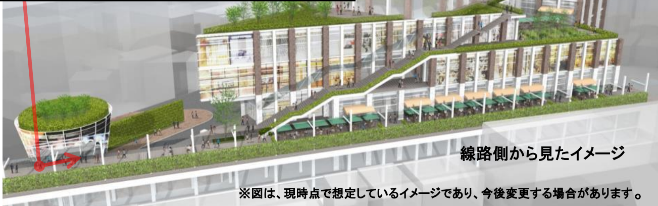
線路側から見たイメージ