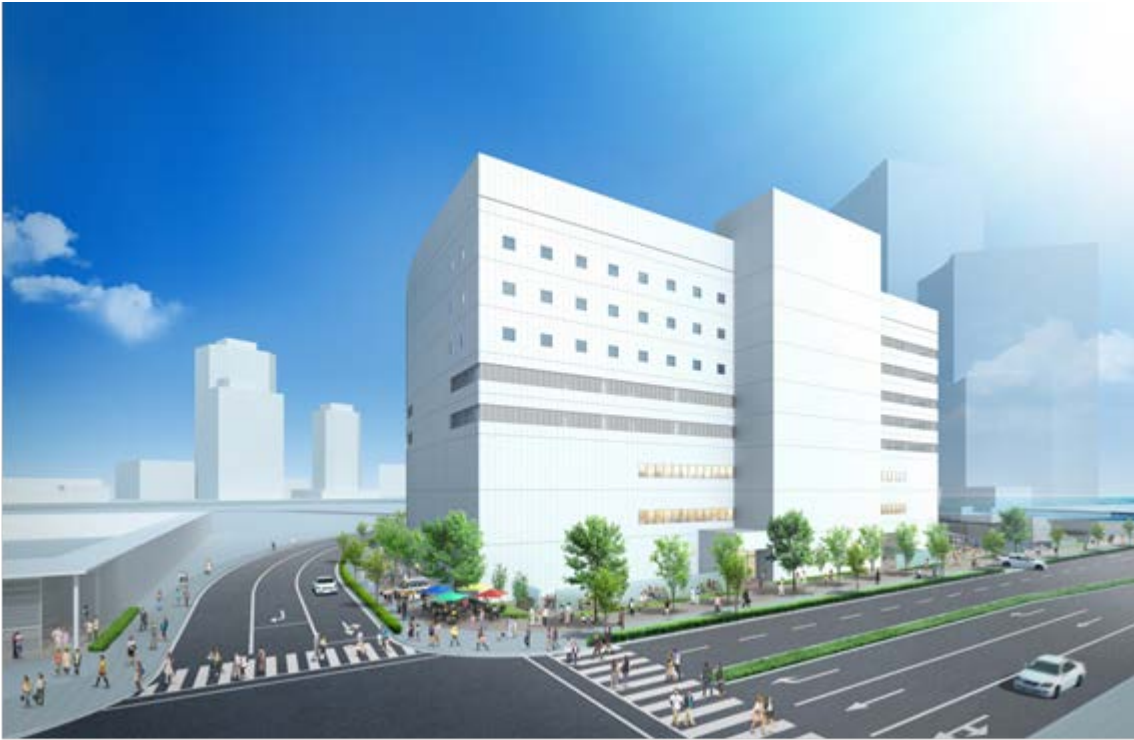
イメージパース 59街区 A 南側より