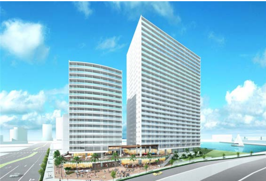
イメージパース 59街区 B 東側より