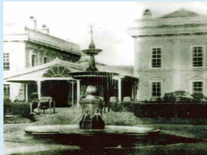
横浜停車場(現在の桜木町駅)前の噴水塔(明治20年)