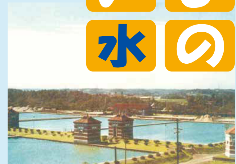
完成時の西谷浄水場緩速ろ過池(大正4年)

「横浜のおいしい水」検定は、横浜の水道水について、楽しく学んでいただける検定です。