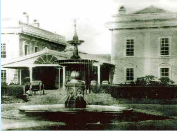
横浜停車場(現在の桜木町駅)前の噴水塔(明治20年)