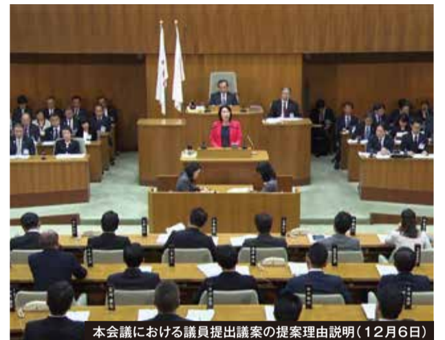
本会議における議員提出議案の提案理由説明(12月6日)

※2項道路…建築基準法第42条第2項で規定された「基準時(昭和25年11月23日)」において、建築物が建ち並んでいる幅員4m未満の道で、横浜市が指定した道路。この道路に面している敷地は、道路の中心線から2mの後退線を道路の境界線とみなし、門扉等を後退させることが必要となります。