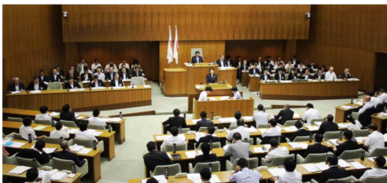
Imagem do Salão de Assembléias