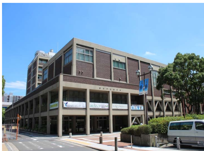
Prédio da Câmara Municipal de Yokohama