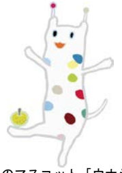
戸塚区のマスコット「ウナシー」

喫煙禁止地区の制度が始まってから10年が経過し、制度の周知・理解が深まっています。指定地区内での指導員による巡回指導や喫煙所設置の効果もあり、吸い殻のポイ捨ても徐々に減少し、街の美化が図られてきています。