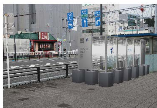
西口バスセンター喫煙所