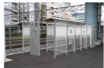
西口大踏切デッキ下喫煙所