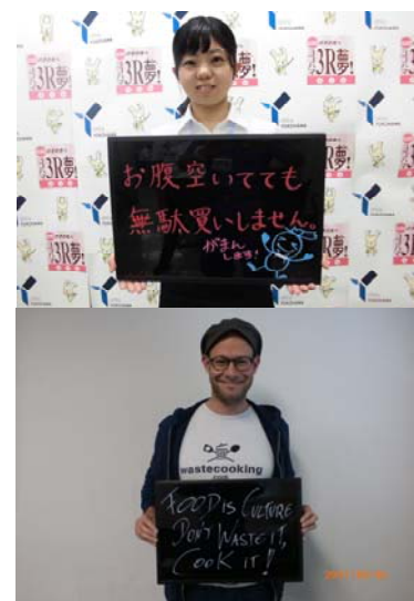
【 メッセージ写真 】